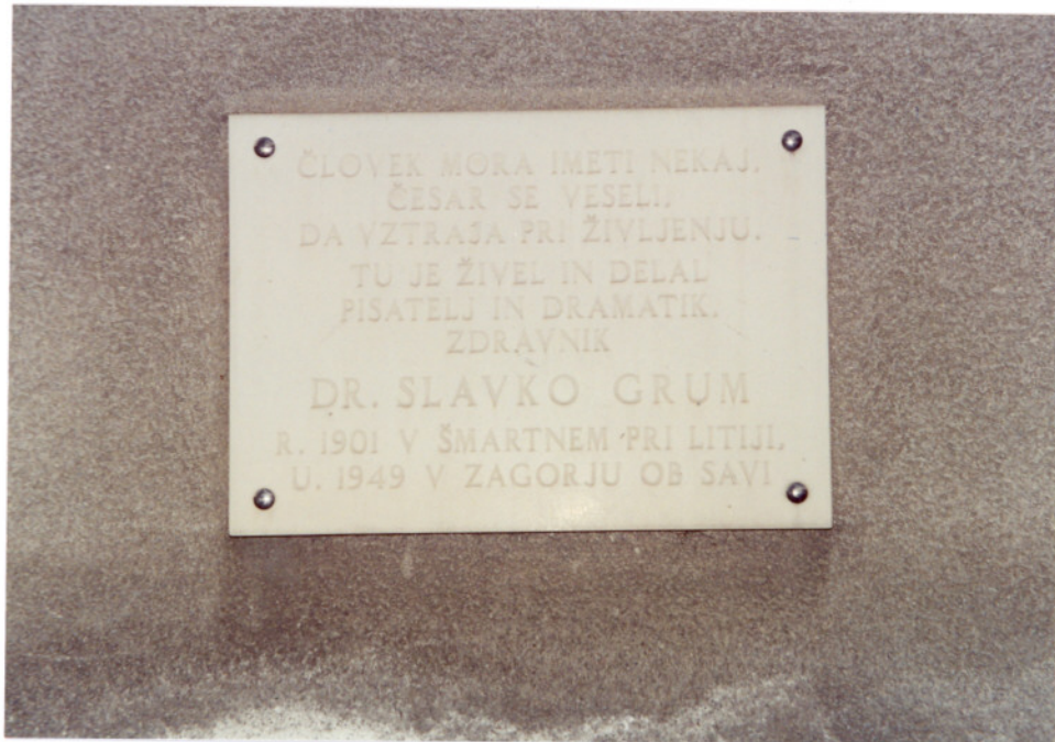
Spominska plošča na Dolančevi hiši

V svečanem sprevodu so ga do železniške postaje pospremili mnogi Zagorjani. Pokopali so ga v Novem mestu.