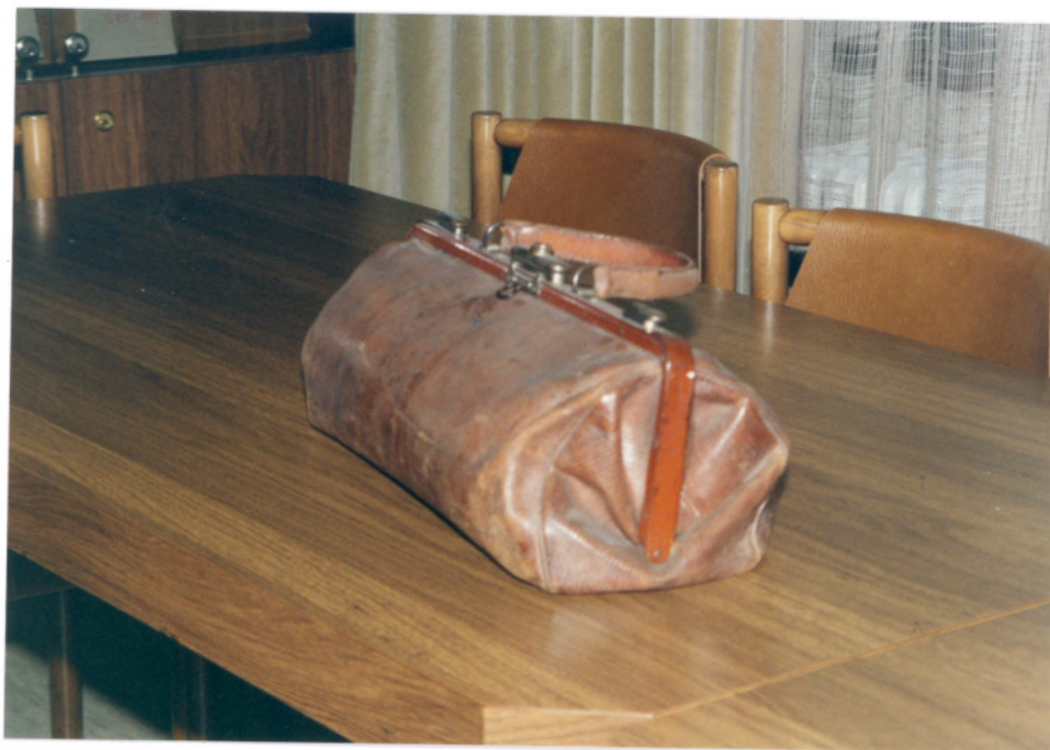
Zdravniška torba iz tistega časa

Bil je mož navad. Vsako jutro je na tešče spil kozarec mrzle vode izpod pipe. Dan za dnem je bil razpet med ordinacijo, obiski na domu, sprehodom do lekarne in večernim obiskom gostilne "Pri Grčarju". Vedno je bil elegantno oblečen, z zdravniško torbo v roki ali pa s sprehajalno palico.