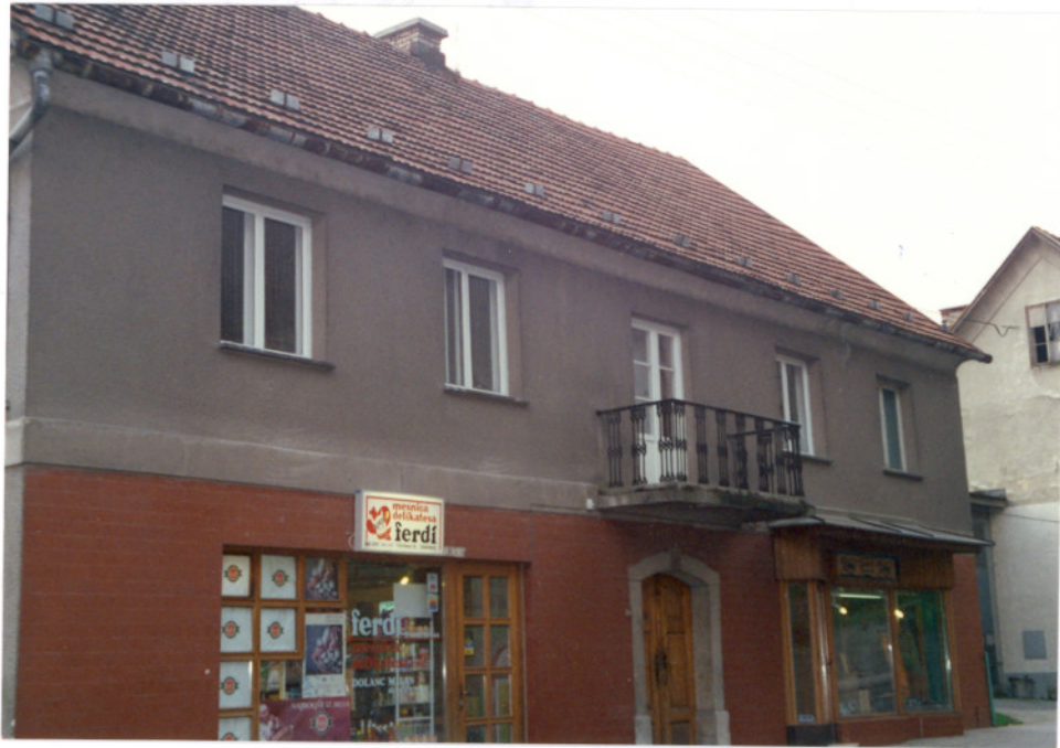
Kokoletova, danes Dolenčeva hiša v Zagorju

Od zdravnika krajevne bratovske skladnice je leta 1939 napredoval v banovinskega zdravnika. Preselil se je h Kokoletovim, kjer mu je gospodinjstvo začela voditi njegova mati.