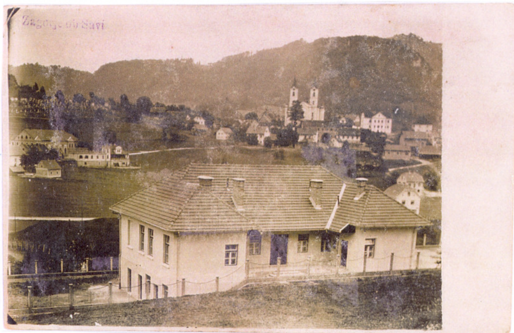
Izolirnica v Dolenji vasi

Hujše primere obolelih ali poškodovanih je pošiljal v izolirnico, rumeno, pritlično stavbo, na samem, na robu zagorske kotline, v Dolenji vasi; kjer so zdravili nalezljive bolezni, in v Bolnico bratovske skladnice v Trbovlje ali v Ljubljano.