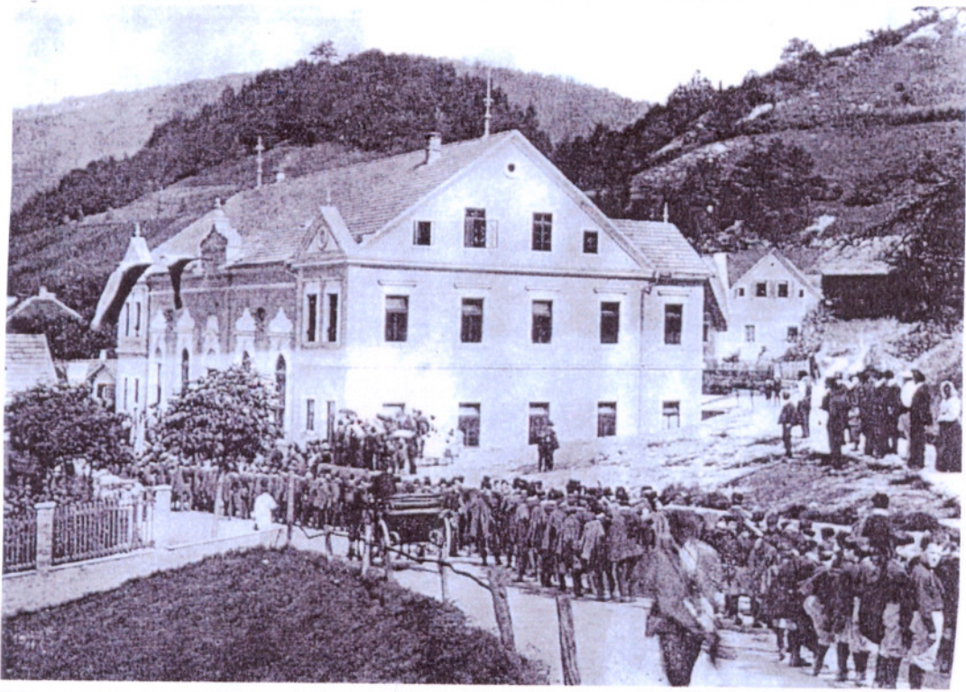
Otvoritev Sokolskega doma v Zagorju

pred vrhom obnemore in mu je potreben le še poslednji napor, da doseže svoj cilj.