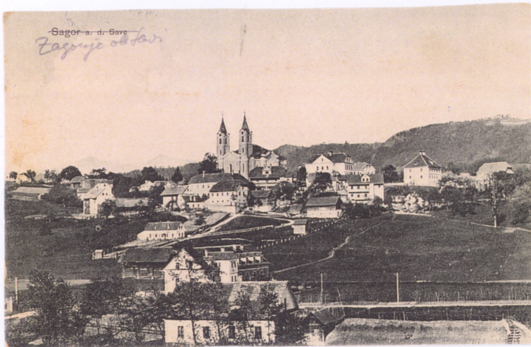
Center Zagorja okrog župne cerkve